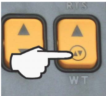
Taste am Somfy Montagekabel, Art.Nr. 9 013 142

⇒ Der Antrieb reagiert jetzt sofort auf einen Fahrbefehl.